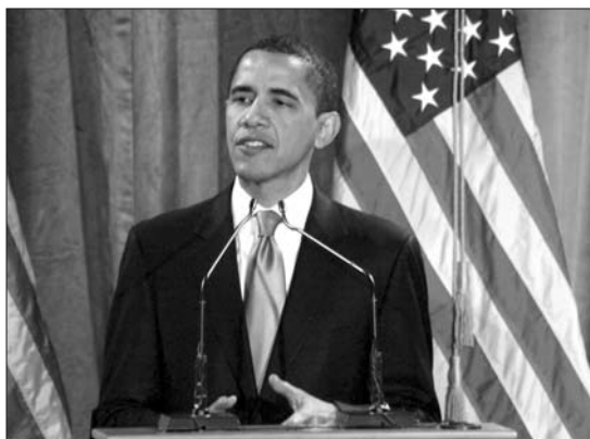
'Parimet' kundrejt 'personit dhe personalitetit'

Andaj, me këtë rast, pyesim: A thua vërtetë këto zgjedhje ishin historike? Nëse po, atëherë vallë çka i bën ato të tilla?