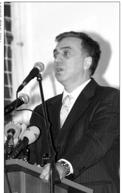
Obraćanje predsjednika Vujanovića