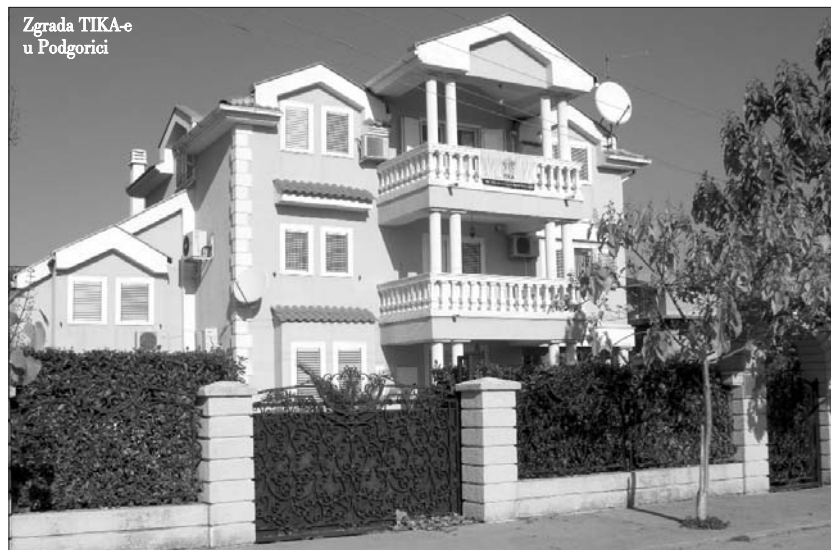
Zgrada TIKA-e u Podgorici