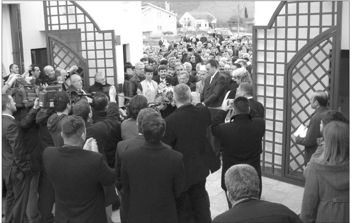
Predsjednik Vujanović, u društvu reisa Fejzića i turskog ministra Jazikioglua, svečano presijeca vrpce otvaranja Medrese

On je citirajući ajet iz Kur'ana kazao da je Bog sve nas stvorio od jednog čovjeka i jedne žene i podijelio nas na narode i plemena da bi se upoznali,