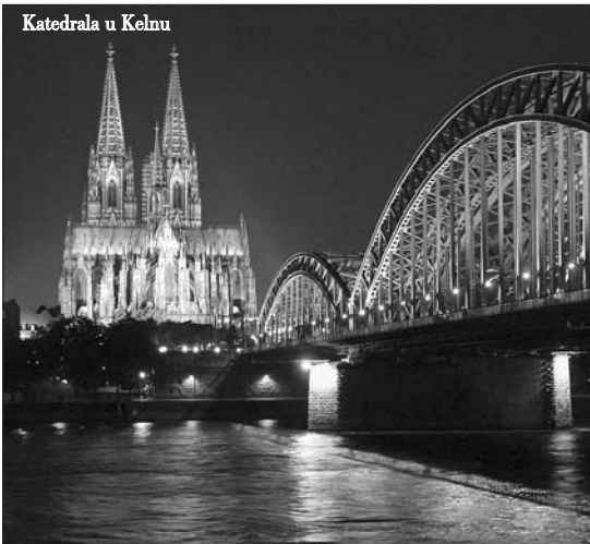
Katedrala u Kelnu

„Ovo je bila jedna od najtežih stvari koju smo ikada uradili“, piše, između ostalog, u saopštenju porote, koja je šest dana zasjedala kako bi donijela konačnu odluku.