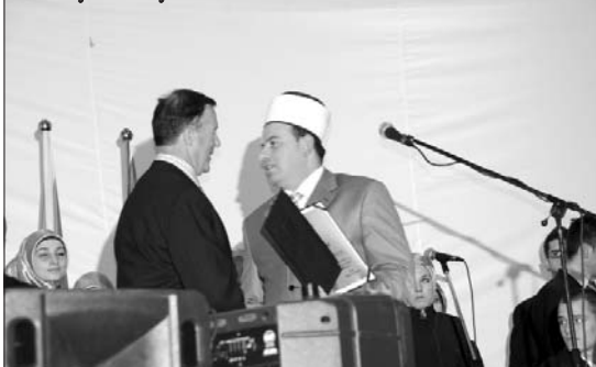
Reis Fejzić uručuje zahvalnicu Đokoviću