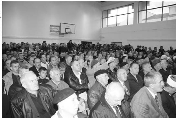
Detalj sa otvaranja