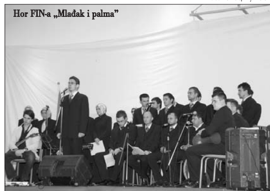
Hor FIN-a „Mladak i palma“

Zadivljen sam poštovanjem koje muslimani Crne Gore, u skladu sa kur'anskim i hadiskim nalogima, iskazuju prema svojim vjerskim i političkim predstavnicima, prema Reis-efendiji Fejziću, čiji su govor pozdravljali aplauzima, ali i prema predsjedniku Vujanoviću, čije su političke ocjene i stavove okupljeni muslimani također pozdravljali aplauzima. Imao sam priliku slušati brojne političke govore, i stekao čulo da razlučim licemjerno od iskrenog obraćanja